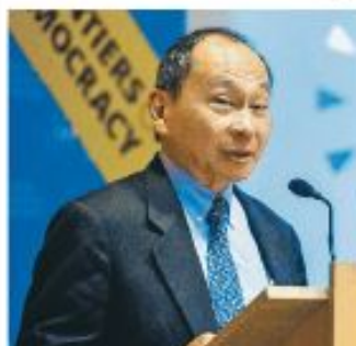
Francis Fukuyama szerint már nem vagyunk „problémamentesek”

Fukuyama szerint az Európai Unióban rosszul súlyozták, milyen területeken kapjon erős hatalmat Brüsszel, és miben maradjon erőtlenség. „Az EU csak közös fiskális po-